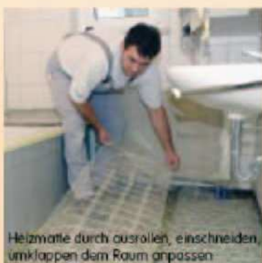
Heizmatte durch ausrollen, einschneiden, umklappen dem Raum anpassen