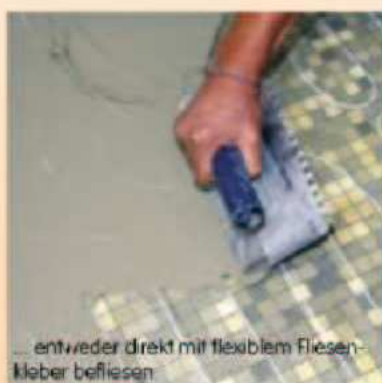
... entweder direkt mit flexiblem Fliesenkleber befliesen