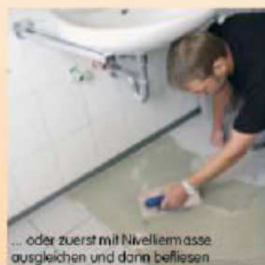
... oder zuerst mit Nivelliermasse ausgleichen und dann befliesen

Wählen Sie anhand der zu beheizenden Fläche Ihre Paketgröße: